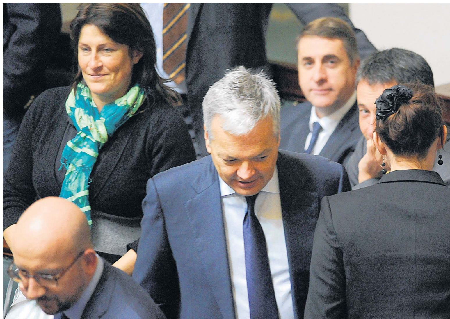
Charles Michel kan het zich niet veroorloven de Reynders-aanhangers tegen zich in het harnas te jagen.

START SOCIAAL-ECONOMISCHE ONDERHANDELINGEN