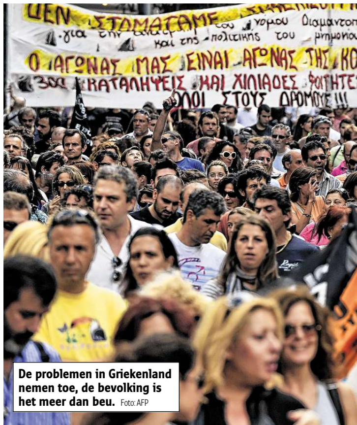
De problemen in Griekenland nemen toe, de bevolking is het meer dan beu.