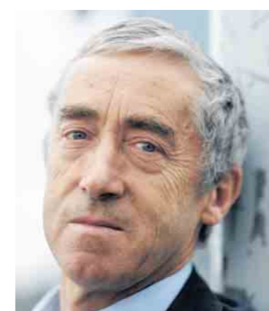
Paul de Grauwe.

BRUSSEL | Het was Martin Wolf, de gezaghebbende commentaarschrijver van de Financial Times , die de aandacht trok op wat hij 'een belangrijke studie' van De Grauwe noemt, overigens ook al jaren een columnist van de FTI . 'Ik wou dat ik dit geschreven had', reageert de Amerikaanse topeconoom Paul Krugman op zijn blog. 'Als je enkel naar de schuldgraad en het begrotingstekort kijkt', zegt De Grauwe, 'dan zou je denken dat Spanje er veel beter voorstaat dan Groot-Brittannië.' Toch zetten de markten Madrid