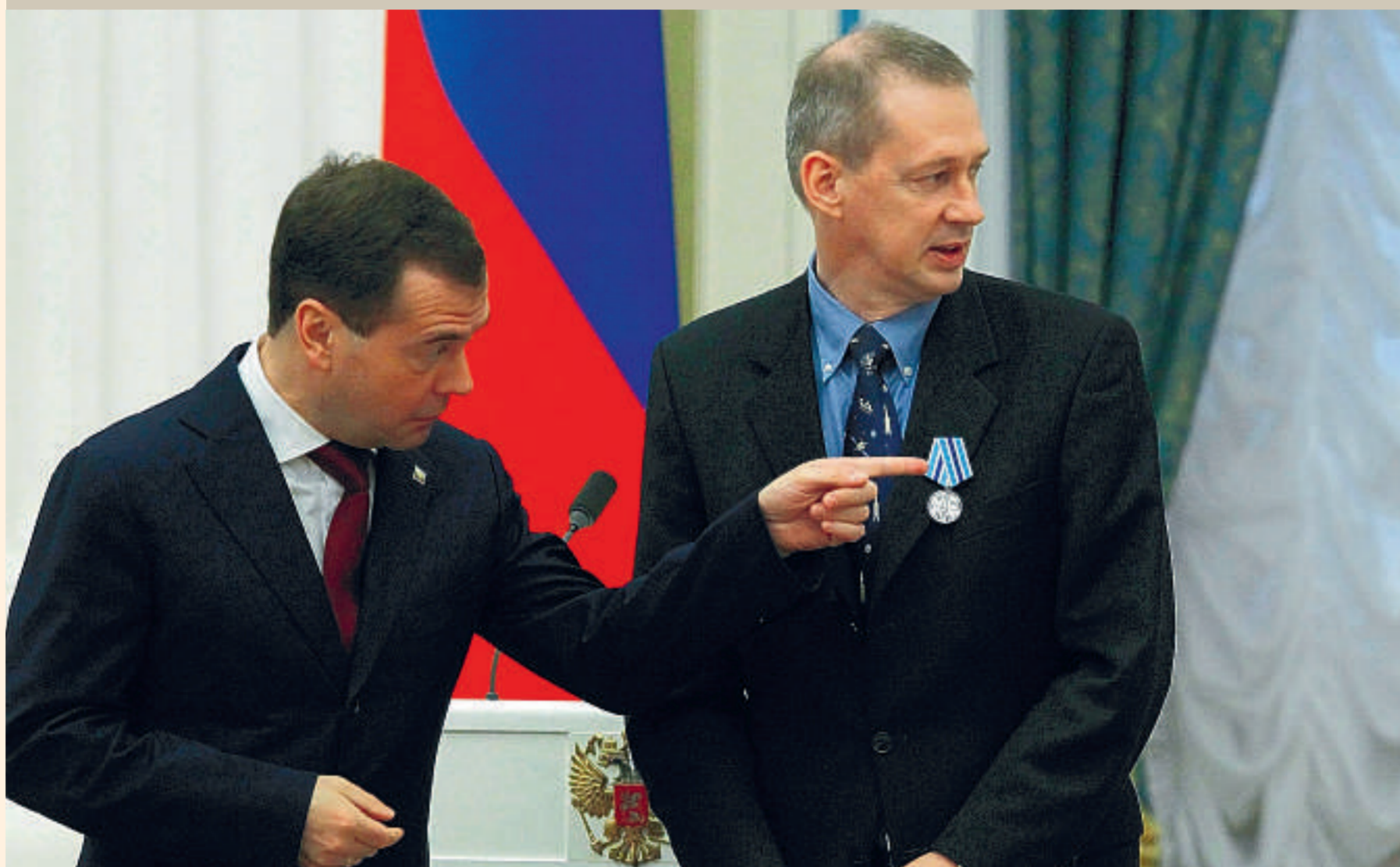
Naar aanleiding van de 50ste verjaardag van de eerste bemande ruimtevlucht, die van de Rus Joeri Gagarin, heeft de Russische president, Dmitri Medvedev (links), gisteren het belang van internationale samenwerking in de ruimtevaart beklemtoond en daarbij ook buitenlandse astronauten in zijn hulde betrokken. Medvedev heeft een speciale Medaille van Verdienste gecreëerd voor de ruimte-exploratie, niet alleen voor kosmonauten maar ook voor ruimtevaarders uit landen die aan missies met Russische collega's hebben deelgenomen, zoals de Belg Frank De Winne (rechts).