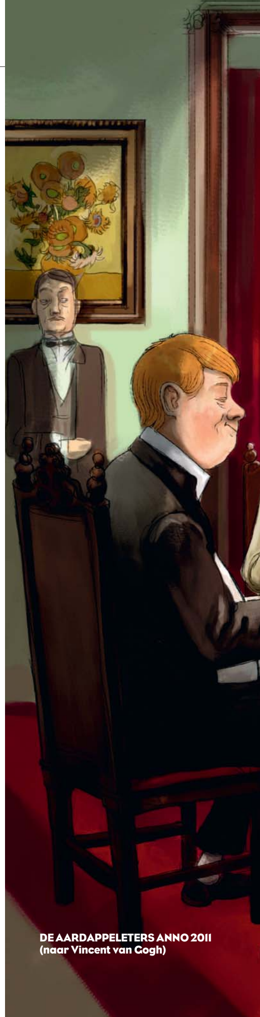
DE AARDAPPELETERS ANNO 2011 (naar Vincent van Gogh)

De groep die zich verzet tegen deze maatschappelijke contractbreuk van prijsstabiliteit wordt, gegeven de vergrijzing, steeds talrijker en dus politiek invloedrijker. Hun vermogen is kwetsbaar voor inflatie, aangezien het op vrij grote schaal is opgeborgen in langlo- ➤