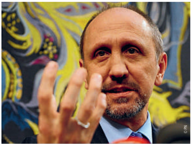
Het model van Johan Vande Lanotte (sp.a) zou perverse effecten hebben, luidt de kritiek.

In het model voor een nieuwe financieringswet dat koninklijk bemiddelaar Johan Vande Lanotte (sp.a) op tafel heeft gelegd, duiken steevast twee mythes op: dat de federale staat exclusief zou profiteren van de groei van de personenbelasting, ten koste van de regio's, en dat dat zou leiden tot een automatische belastingverhoging.