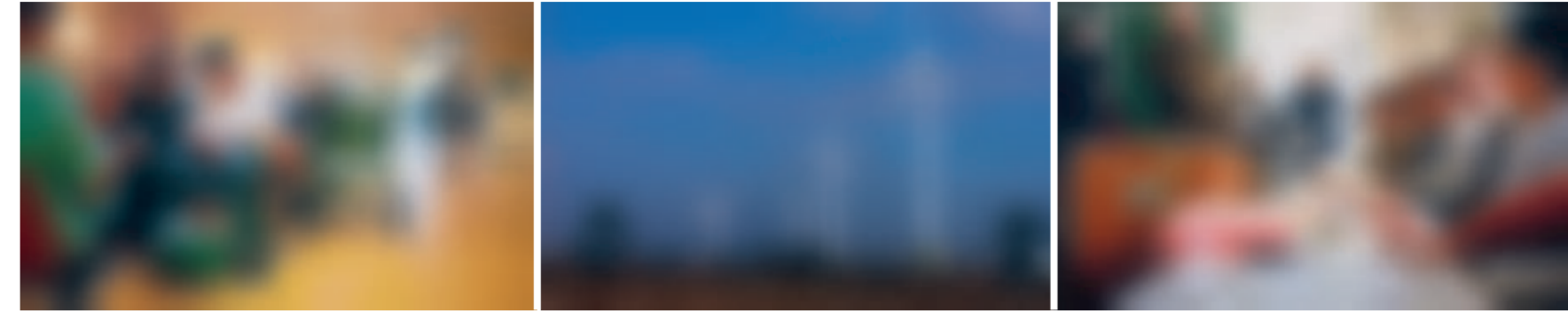
■ De levenskwaliteit in een land wordt ingeschat aan de hand van criteria als gezondheidszorg, investeringen in hernieuwbare energie en democratische waarden.

De index meet de levenskwaliteit aan de hand van de duurzaamheidsindex, een rangschikking van landen op basis van de Human Development Index. Daarin probeert de Organisatie voor Economische Samenwerking en Ontwikkeling (OESO) op basis 53 criteria (zoals productiviteit,