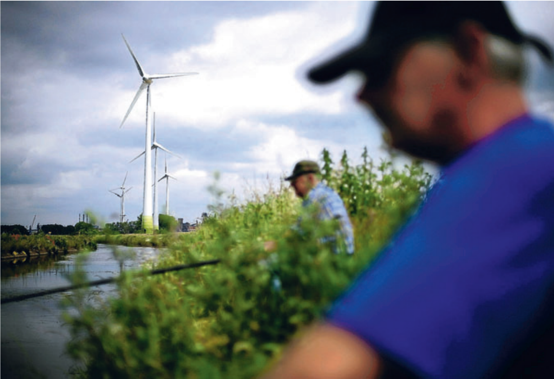
Het windturbinepark van SPE en Ctipower in Eevergem. Via allerlei holdings spelen de gemeenten een cruciale rol in de energiebedrijven SPE-Luminus, Elia en Fluxys.

Publi-T kan de aandelen van Electrabel kopen door een combi- natie van liquide middelen en het aangaan van schulden. Of het nog extra aandelen bijkoopt bij de kapitaalverhoging, is niet bekend. Maar het ligt in de lijn vande ver- wachtingen dat Publi-T de opera- tie niet helemaal volgt. ■