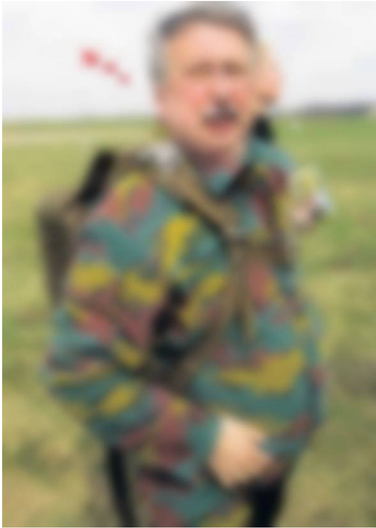
André Flahaut wou president Joseph Kabila een eredoctoraat geven.

Een jaar geleden ging zijn bezoek aan een café in New York niet onopgemerkt voorbij omdat hij licht beschonken over 'de lichtjes van Defensie' begon te zingen. En enkele maanden geleden zou hij zich op een terugvlucht van Afghanistan onhebbelijk hebben gedragen en de bemanning van