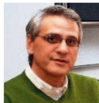
Kris Peeters: 'De technici zijn klaar, nu is het aan de politiek om te landen in dit dossier.'

BRUSSEL ● In maart 2009 besliste de Vlaamse regering om de finale beslissing over het Oosterweeltracé over de verkiezingen en het Antwerpse referendum heen te tillen. Peeters heeft zich exact een jaar extra gekocht, maar de beslissing is er alleen maar moeilijker op geworden. Een overzicht van de wankele fundamenten.