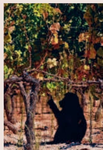
De bavianen zijn vooral verlekkerd op de duurdere druivensorten.

De harde, zure exemplaren worden gewoon op de grond gooid, al gaan de beesten nu en dan ook zelf tegen de grond. Druiven fermenteren in de zon en brengen de apen soms in een licht beschonken toestand. Veel oplossingen om de plunderaars te stoppen zijn er niet. De bavianen omzeilen moeiteloos elektronische omheiningen door een simpele tunnel te graven onder de elektrische bedrading. Ook de vuuzela, het intussen beruchte hoorninstrument dat Zuid-Afrikaanse boeren om 'sfeer' te creëren in sportstadia, slaagt er niet in de dieren te verdrijven. Veel wijnboeren proberen de bavianen nu op afstand te houden met nepslangen. De aanwezigheid van de apen is toe te schrijven aan de bosbranden die Zuid-Afrika teisterden en grote delen van het leefgebied van de bavianen vernietigden. Ook de uitdijende wijngaarden bedreigen hun territoria.