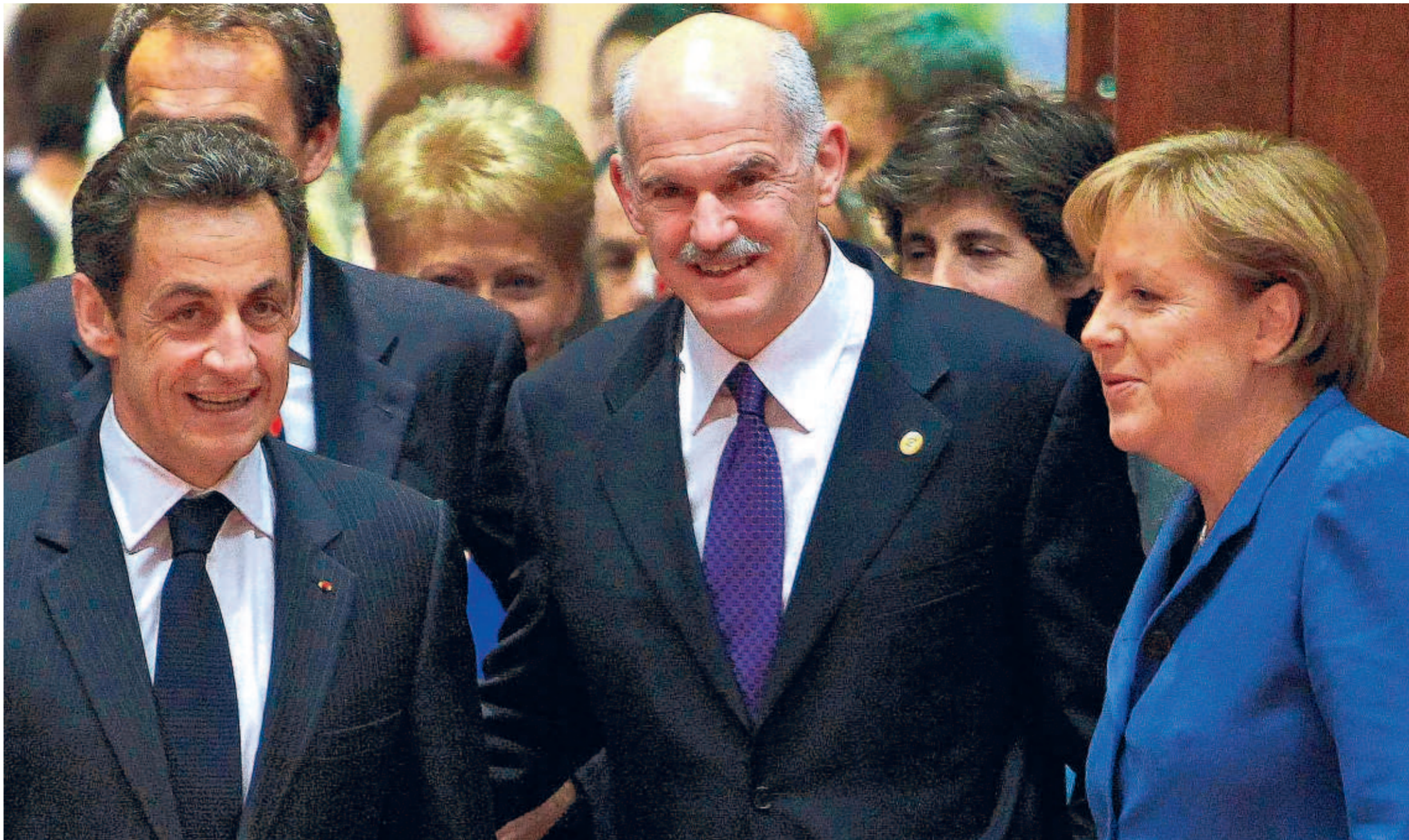
(vlnr) De Franse president Nicolas Sarkozy, de Griekse eerste minister George Papandreou en de Duitse bondskanselier Angela Merkel begroeten elkaar bij de start van de Europese top.

Griekenland kan worden geholpen door zowel de eurolanden als het IMF