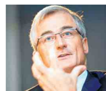
Geert Bourgeois (N-VA).

In het Vlaams Parlement kreeg Geert Bourgeois er zwaar van langs. De voltallige oppositie én de meerderheidspartijen SP.A en CD&V torpedeerden het Roma-actieplan waarmee de minister van Inburgering de instroom van Romazigeuners in Vlaamse steden aanpakt. Dat draaide in de soep, want Bulgare en Roemeense media meldden prompt dat de Roma welkom zijn in België. De N-VA-minister kon zijn communicatie in allerijl bijsturen met Bulgare en Roemeense persberichten en hulp van de ambassades in Sofia en Boekarest. 'Mocht een federale minister dit doen, de N-VA had hel en verdoemenis ge-