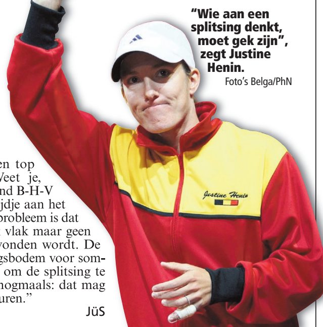
"Wie aan een splitsing denkt, moet gek zijn", zegt Justine Henin.

voel me op en top Belgische. Weet je, die kwestie rond B-H-V is nu al een tijdje aan het draaien. Het probleem is dat er op politiek vlak maar geen oplossing gevonden wordt. De ideale voedingsbodem voor sommige mensen om de splitsing te eisen. Maar nogmaals: dat mag echt niet gebeuren."