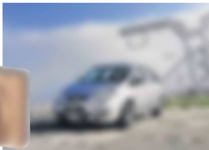
Onder meer speelgoed, elektronica en auto's uit China zouden een pak duurder worden.

van de Amerikaanse dollar. Dat doet de Chinese overheid niet van ganser harte. De officieel lage kostprijzen van Chinese goederen zetten namelijk al geruime tijd kwaad bloed bij de Verenigde Staten, waar de industrie lijdt onder de zware concurrentie. In het Amerikaanse parlement wordt er almaar luider