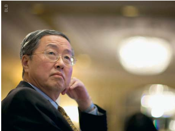
ZHOU XIAOCHUAN De Chinese centrale bankier heeft een plan voor een nieuwe reservemunt.

➤ Muntfonds (IMF) is daarvoor uitgevonden, maar de Aziaten vertrouwen het IMF niet echt, omdat het gedomineerd wordt door westerse aandeelhouders.