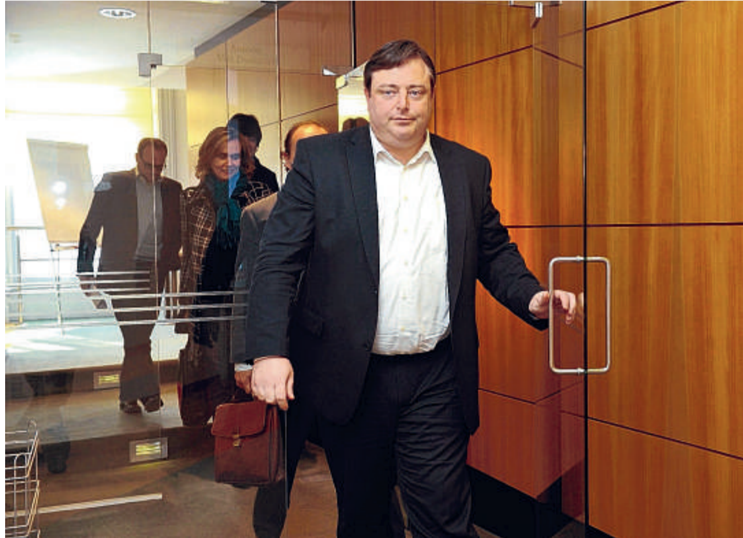
N-VA-voorzitter Bart De Wever pikt de kritiek op zijn voorstel voor een nieuw financieringsmodel voor België niet.