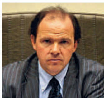
Vlaams minister Philippe Muyters.

De toename van de schulden is in het Vlaams Parlement voor de liberale oppositie van de VLD en LDJ een doorn in het oog. Vooral omdat alle buffers tegen