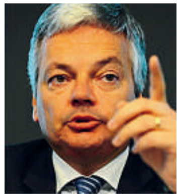
Didier Reynders.

Maar de vrees is toch vooral dat er begin volgend jaar weer parlementsverkiezingen plaatsvinden. En als Didier Reynders dan nog altijd aan het roer staat, kan de Franstalige liberalen andermaal een pandoring te krijgen. Het is meteen een andere parallel die met CD&V kan worden getrokken.