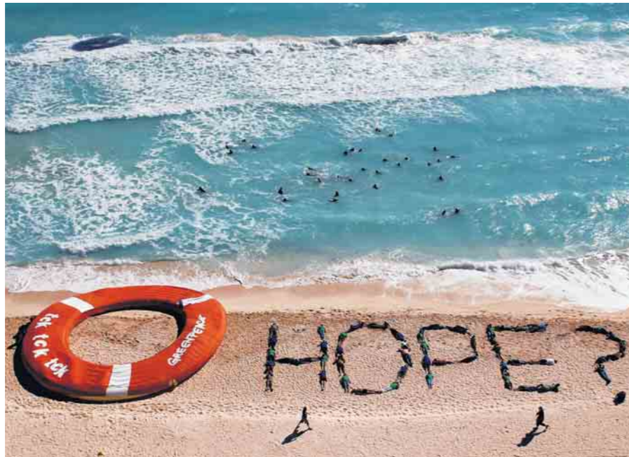
De hoop waar deze activisten zo naar snakken, hebben ze in Cancun niet gekregen.

Eén van die praktijken van onze tijd zijn megaconferenties in voorheen paradisische oorden. Soms is het sop de kool waard, maar was dit ook zo voor de klimaatconferentie in Cancun? Het is niet gemakkelijk de kwaliteit van het sop te meten in de stroom van goed nieuwsverklaringen die werden uitgezonden door organisatoren en deelnemers. Een belangrijk succes lijkt dat het VN-klimaatproces in leven is gehouden. Enerzijds is een VN-proces nodig om overeenkomsten tussen soevereine staten over cruciale mondiale problemen in steen te beitelen. Anderzijds levert dit proces sinds 1997 (Kyoto) weinig resultaten op, en evenmin vooruitzicht op beterschap. Dit proces geraakt niet op snelheid door overgewicht op twee flanken. Ten eerste vermengen de beloftes over toekomstige emissievolumes het kli-