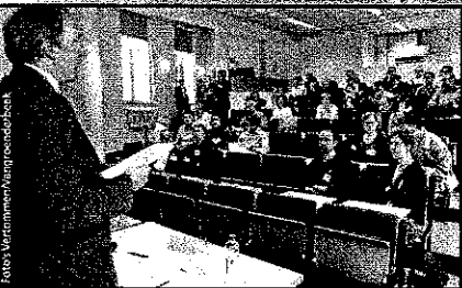
Geen cafépraat maar bloedserieuze exposés in de aula met water en geen frisdrank bij de keelt te smaken.

Vandaag komen brouwers van Moortgat, AB InBev en Lindemans spreken. Ze zullen het ongetwijfeld hebben over de dalende Belgische bierconsumptie. Min 25 procent in laatste twintig jaar. Dronk een Belg in 1970 nog jaarlijks 130 liter bier, dan is dat nu nog 89 liter. De laatste 10 jaar sloot 30 procent van de cafés. Van de 660 brouwerijen in 1950 zijn er nog 115 over. Maar er is ook goed nieuws: sinds 2000 is onze bierexport verdubbeld, van een half miljard liter naar 1 miljard. En de huidige recessie doet de bierconoomie goed. «Economische misère doet mensen meer drinken, en dan liever een goedkope pint dan dure wijn of sterkedrank.»