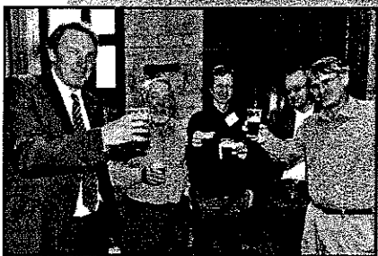
's Avonds heffen de pruts dan toch een glas, in het Leuvense stadhuis.